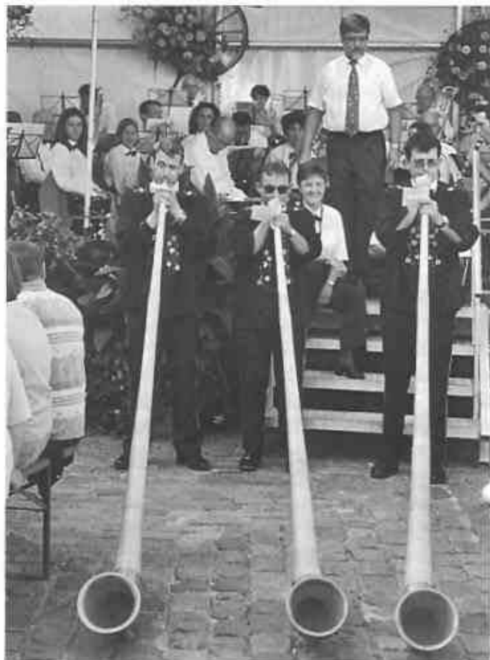
Zum Repertoire ghört au Alphorn ...

Zum Repertoire ghört au Alphorn und Taler- schwinge und zum «sag danke schön» tuet de Georg nochli singe.