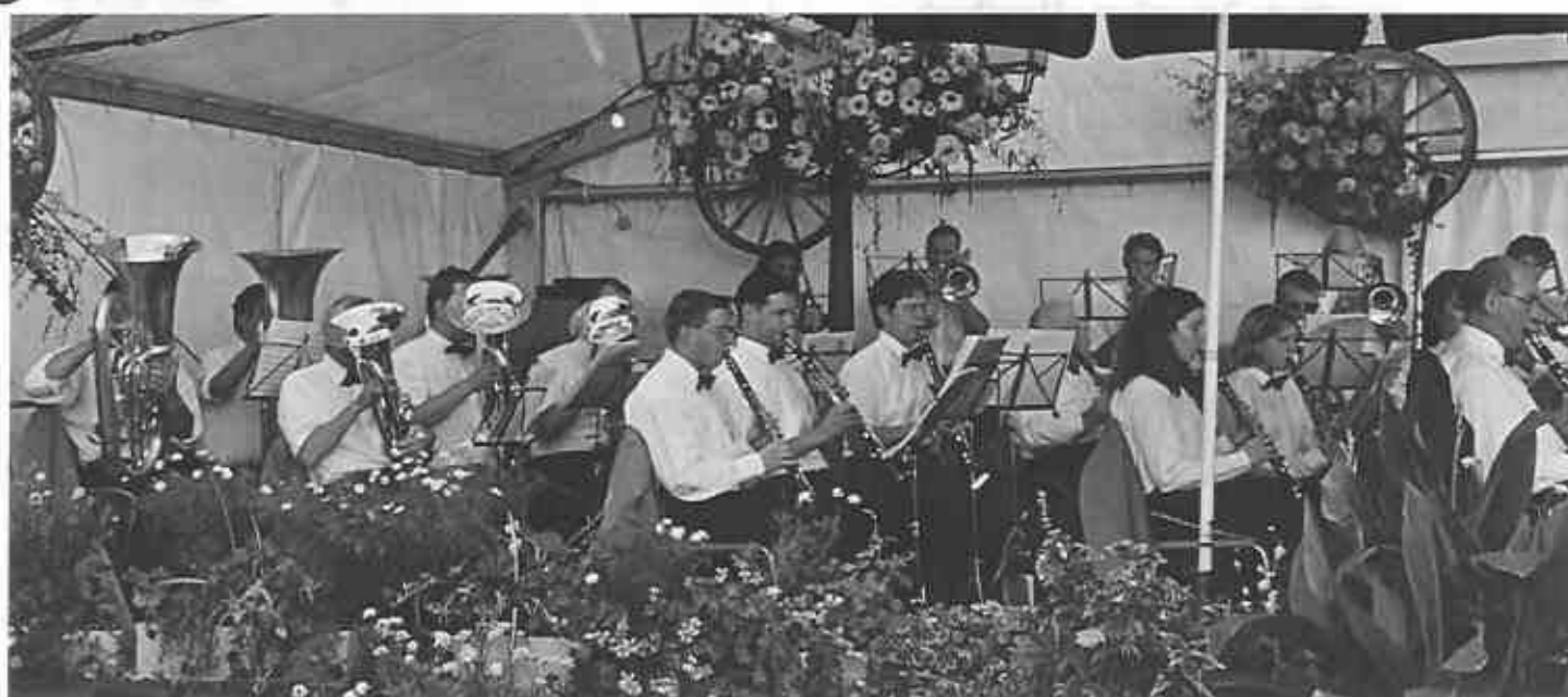
Ein Auftritt der Musikaesellschaft Fislisbach anlässlich der Musikreise nach Meersburg (D)