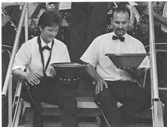
... und Talerschwinge

S'Fäscht es z'End mer gönd langsam heizue doch i de Parkklinik obe get's noni grad Rueh. D'Tür esch bschlosse, mer hetted en Schlüssel braucht und bem Türinspiere hed sich s'Hedy do de Scheiche verstucht.