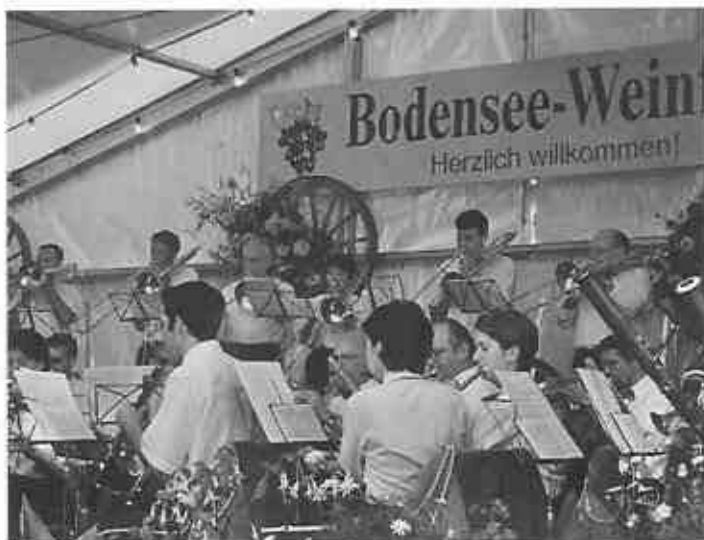
De Winzerverein Meersburg hed do es Riesefescht

Konstanz ladt i zum echli verwile und si öppis trinke, öppis ässe und s'Schiff chont scho gli.